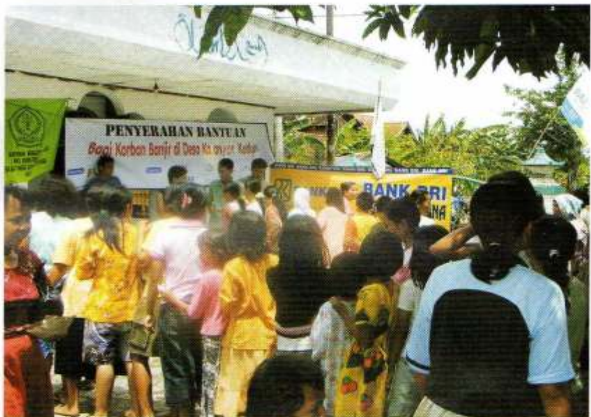
Para korban banjir di desa Payaman sedang antri menerima bantuan sembako dari lembaga zakat termasuk YBM BRI

Banyaknya pengungsi akibat musibah banjir di Jateng dan Jatim membuat Yayasan Baitul Maal BRI