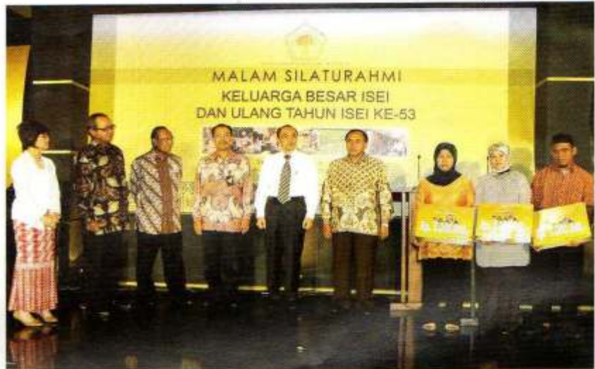
Para pelaku usaha kecil binaan YBM BRI tengah menerima bantuan secara simbolis dari ISEI

Para pelaku UKM, menurut Rudjito perlu dibantu dan difasilitasi agar dapat mengakses modal ke lembaga keuangan. Sebab dengan cara seperti itu para pelaku UKM dapat mengembangkan usahanya. Salah satu upaya ke arah sana, ia menggandeng YBM BRI sebagai mitra penyalur bantuan bagi pelaku UKM.